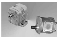
Насосы шестеренные НШ Насосы шестеренные Г11

Склад находится по адресу г. Екатеринбург, Ленинский район, Юго-Запад, Н. Онофриева 55, (рядом с АЦ Краснолесье) при самовывозе со склада, необходимо уведомлять дополнительно, не менее чем за 2 часа для подготовки документов и комплектации заказа. Благодарим за сотрудничество!