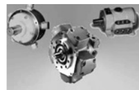
Гидромоторы МРФ Насосы 50НС, 50НР Н403Е