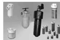
Фильтры ФГМ Фильтры сетчатые