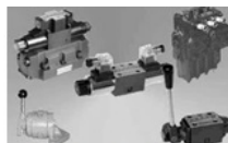
Гидрораспределители 1РЕ Гидрораспределители Р80